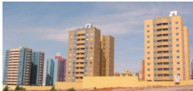
Residencial Giuseppe Verdi e Residencial Johann Strauss, no Condomínio Sinfonia das Águas, Quadra 202, Águas Claras