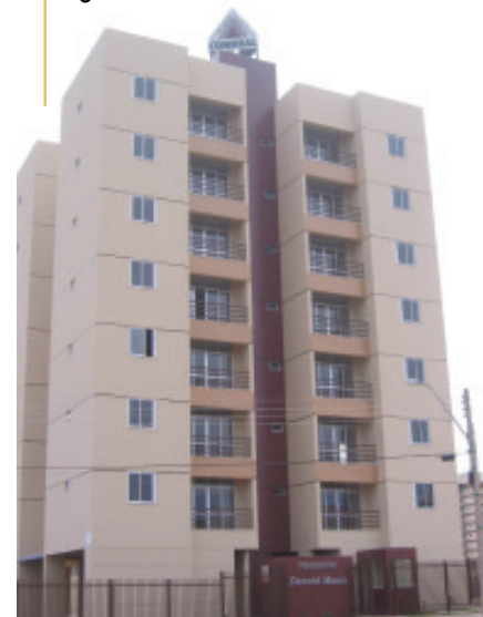
Residencial Danniell Muniz, 28 apt os de 2 quartos, QD. 301 av. Alameda Gravatá, conjunto 09, lote 03 e 05, Águas Claras