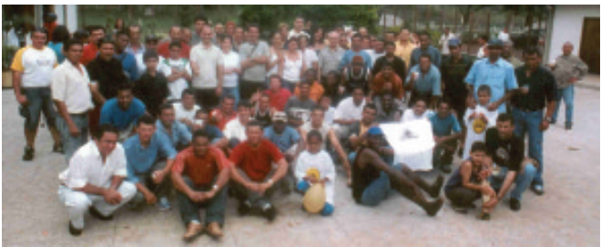
À esq. a disputa pela bola no torneio de futebol. Acima, o grande "time" de funcionários da Conbral