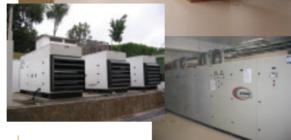
UTI Hospital Brasília, 17 Leitos; Subestação com 2.000 KVA e Grupo gerador 3 unid. com 1.175 KVA, Hospital Brasília, Lago Sul, Brasília