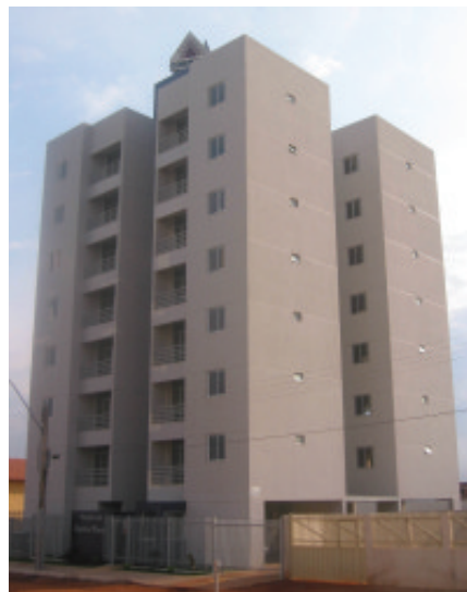
Residencial Raphael Muniz, 28 apt os de 2 quartos, QD. 301 av. Parque Águas Claras, conjunto 04 lote 04 e 06, Águas Claras