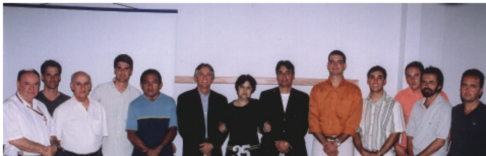
Diretores, Gerentes e Funcionários juntos, nos 35 anos da Conbral

Hoje, a Conbral acumula mais de um milhão de m 2 construídos nos mercados do Distrito Federal, Goiás, Amazonas e Roraima, e é apontada como a quarta maior construtora de Brasília, ocupando a 28ª posição entre as incorporados e construtoras nacionais, segundo classificação da Gazeta Mercantil, publicada em 2002.