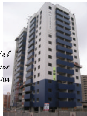
Residencial Osório de Moraes Foto em 14/04/04