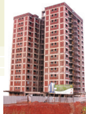
Residencial Orquídeas Foto em 14/04/04