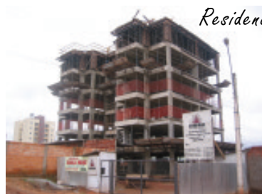
Residencial Érika Muniz Foto em 14/04/04