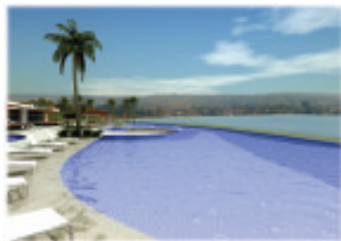
Pespectivas ilustradas das áreas de lazer do Ilhas do Lago