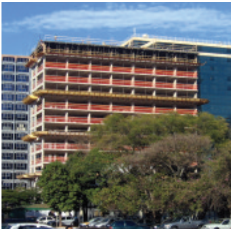
Centro Empresarial João Carlos Saad